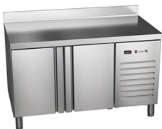
Mod. GR-TGP 135 o GR-TGN 135